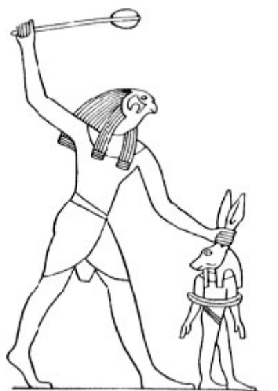
Гор, убивающий Сета

Главная битва есть битва Осириса с Сетом, то есть, с асурами или «Сынами Тьмы» 24 . На примере «египетского посвящённого Иисуса, ставшего Христом» 25 Перит Шу показывает, что в самом имени Иисуса было сокрыто указание на «одическую полярность»: вместе с позитивным слогом «Hjeh» (Ja), означающем в эзотерике Книги Мёртвых «Бесконечное Время», в имени Иисуса присутствовал также слог sus = nun = nsu (Nein), указующий на Святой Дух и «Бесконечное Пространство». Это были как бы «две извечные силы души» - сила вечного Ja, представленная Эоном и сила вечного Nein в лице эфирного «Sausen» 26 Божественного Ветра. В результате получается всё та же триадическая система, которую мы уже видели в как минимум трёх вариантах: волновом (M, R, S), ментальном (Буддхи, разум, ratio) и египетском (Осирис, Хор, Сет). По этой модели разбираются и уравниваются Иисус (Hjeh-Nun-Saeh), Хамса (Ha-on-sa), Иоанн (Jo-hannes) и Дионис (Du-on-ys). Эти паралингвистические откровения более всего напоминают арманические построения Горслебена, видевшего, к примеру, в имени «Бога воинств» Саваофа указание на троичность Божественного Начала (Це-Ба-От как Зевс-Баал-Од, Тевт-Бальдр-Один или Тиу-Баал-Адонай). В своей монументальной работе «Золотой Век Человечества» Рудольф Йон Горслебен выстраивает следующую триадологию: