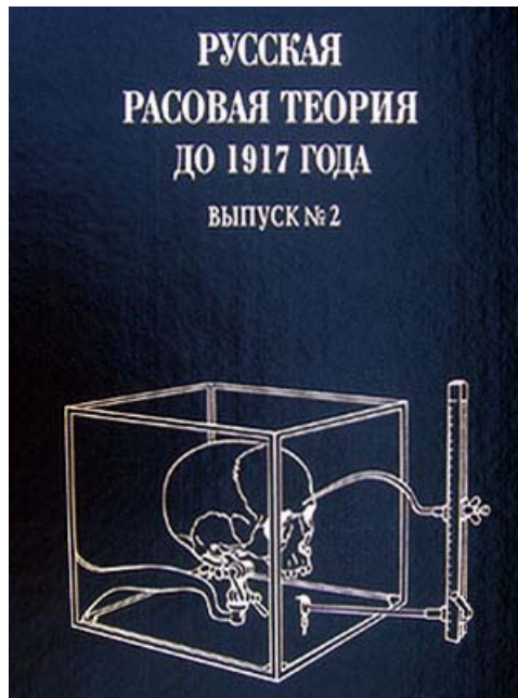
Umschlag der russischen Auflage Moskau 2004

düstere Unkenrufe über die Entartung des russischen Volkes zu hören, doch in der Seele des Experten, dem Sie die hohe Ehre Ihrer Aufmerksamkeit erwiesen haben, wallt bei den Worten „Rußland“ und „Russisches Volk“ unbändige Lebensfreude hoch; er empfindet keine Verzweiflung und stimmt keinen Klagegesang an. Ich bin überzeugt, daß dieses Gefühl uns alle verbindet!