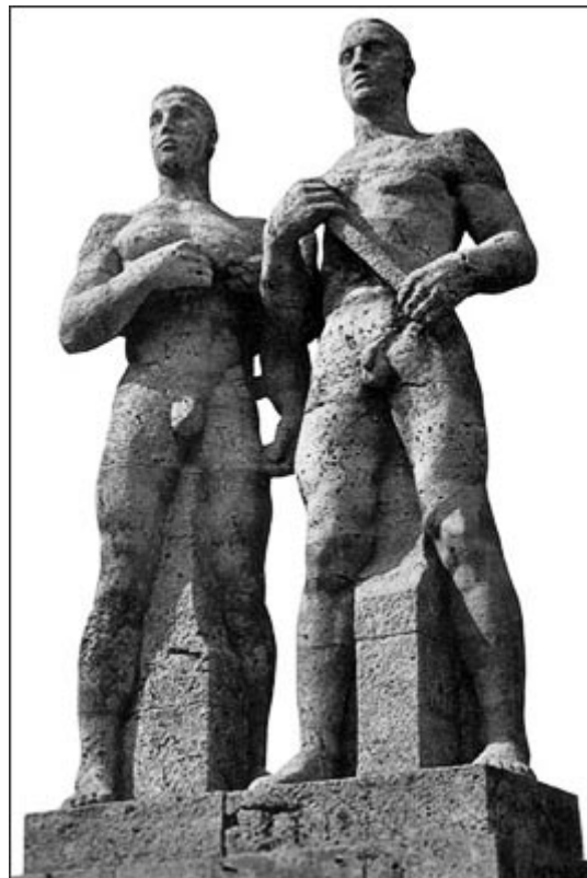
Albiker (1878-1961): Zwei Männer

Unvollkommene erst – vollkommene Ewigkeit. In der Geschöpfe Pracht erst vollendet sie sich. Und der Mensch hört auf die Stimme, die in ihm mahnt – und wird selbst Wahrer und Künder des Ewigen und Walter an der Vollkommenheit des ewigen Willens. So reicht er die gefüllten Eimer weiter. So ist sein Werken Gottesdienst. Oder aber er läßt die Stimme überlärmen. Dann hört er nicht den Lotsen, der ihn lenkt; dann geht er irre; dann verliert er Anfang und Ende und hat nur noch sich selbst; dann aber vergeht er sich am ewigen Sinn – und wird weggetan und ausgelöscht. Höre, mein Volk! Bist auch du reines Gefäß? Bist auch du Vollender und Vollstrecker ewigen Auftrags? Oder bist du Untiefe dem Strom, und Fälscher am ewigen Wirklichen? Bist du reine Form und reine Art – oder bist du mißgestaltet und entartet? Die Schöpferhand schwebt über dir, bereit, die Fülle des Unendlichen in deine Seele zu gießen – oder aber dich zu zerdrücken und wegzuwischen, damit Raum werde für reine Art. Höre, mein Volk! Du aber sollst Vollender sein! Du aber sollst ewigen Willen in deinem Blute tragen – und weitergeben an zukünftige Ewigkeit! Darum soll deine Art rein bleiben und stark werden! Darum sollst du alle Mißgestalt abtun und Wohlgestalt suchen! Höre, deutsches Volk! So vollende dich! Damit das Ewige durch dich – vollendet werde!