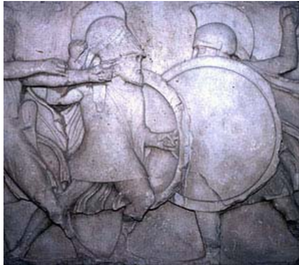
Nahkampf zweier Hopliten (Krieger zu Fuß)

Typisch sind der Korinthische Helm und der Rundschild, Hoplion . Der Bildhauer hat einen Krieger mit geöffnetem Helm dargestellt, um eine bekannte Person als Krieger zu würdigen.