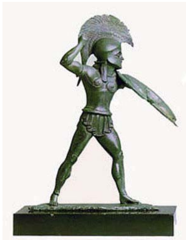
Statuette eines spartanischen Hopliten (13 cm hoch, um 510 v.d.Z.)

In dieser weltberühmten und oft zitierten Grabinschrift wird die Erinnerung an den Spartanerkönig Leonidas und dessen dreihundert Elitesoldaten, die 480 v. Chr. heldenhaft den Paß in der legendären Schlacht an den Thermopylen verteidigten, wach gehalten. Neben den unmittelbaren militärischen und politischen Folgen entfaltete dieses Ereignis seine weltgeschichtliche Bedeutung in dem hierdurch eingeleiteten Sieg gegen die anrennenden Perser und der damit ermöglichten Rettung des Abendlandes.