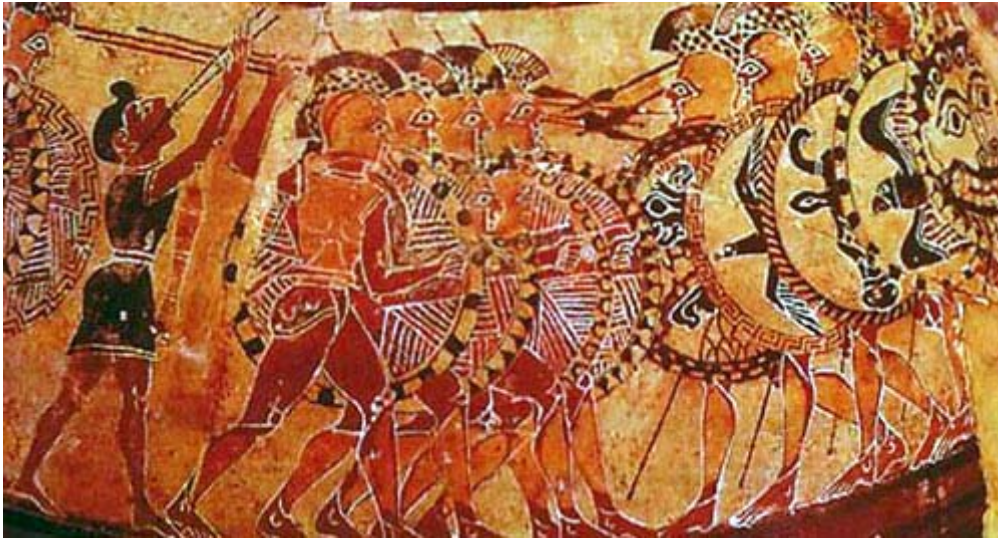
Hopliten werden von einem Flötenspieler in den Kampf geführt.