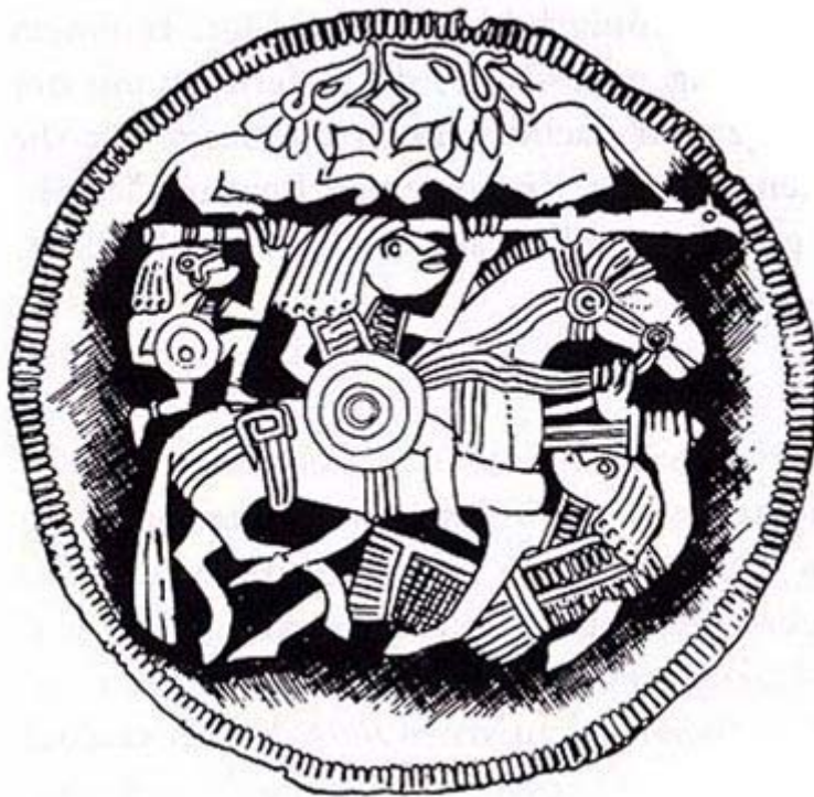
Der Siegshelfer von Pliezhausen

Den Aspekt die Macht des Gottes am Sieg über die Feinde prüfen und ablesen zu wollen, war für eine kriegerische Kultur essentiell. Dieses so genannte ‚Siegshelfermotiv‘ wird durch einen Fund des späten 7. oder 8. Jhd. deutlich. In Pliezhausen bei Tübingen 4 wurde unten abgebildete Zierscheibe gefunden, die den Kampf zwischen einem Reiter und einem Schwertkämpfer zeigt, der im Kampf zu Boden geht. Obwohl der Reiter im vollen Galopp im Begriff ist, seinen Speer gegen den oder die Feinde zu schleudern, gelingt es dem am Boden liegenden Krieger, die Zügel des Pferdes zu ergreifen. In diesem Moment greift der göttliche ‚Siegshelfer‘ ein, der als beschilderte kleinere Figur am linken oberen Rand der Scheibe zu sehen ist und mit seiner überdimensioniert großen Pranke den Speer des Reiters umfaßt und diesen beim Wurf stärkt. Hier muß von heidnischen Vorstellungen des Trägers der Zierscheibe ausgegangen werden. Immerhin zu einer Zeit, in der die Christianisierung der kontinentalgermanischen Stämme im Abschluß begriffen war. Ein beeindruckender Beleg für die zähe Langlebigkeit germanischer Kulturmuster.